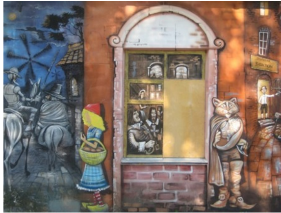
Illustrations for "Alice's Adventures in Wonderland", "The Little Golden Calf" and "Heart of a Dog"

Some kind of collage. There is a "don Quixote" and "Three Musketeers" and "Return to Treasure Island", as well as "Little Red Riding Hood" and "Puss in boots".